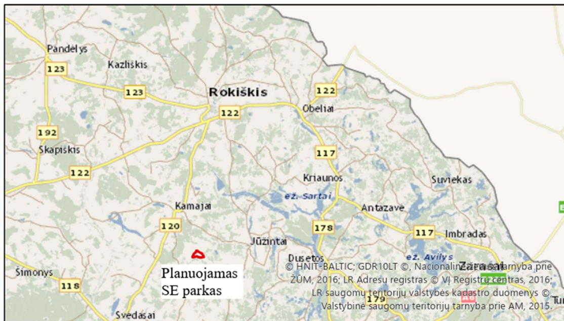
1 pav. Planuojamo SE parko vieta Rokiškio rajone

Planuojamos teritorijos (SE parko) vieta pavaizduota paveiksle žemiau.